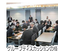
グループディスカッションの様子

社員全員が共通認識を持ち、強みを「見える化」する(=管理指標KPIを特定する)ことが知的資産経営の第一歩となります。