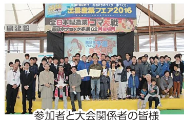
参加者と大会関係者の皆様