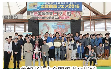
参加者と大会関係者の皆様